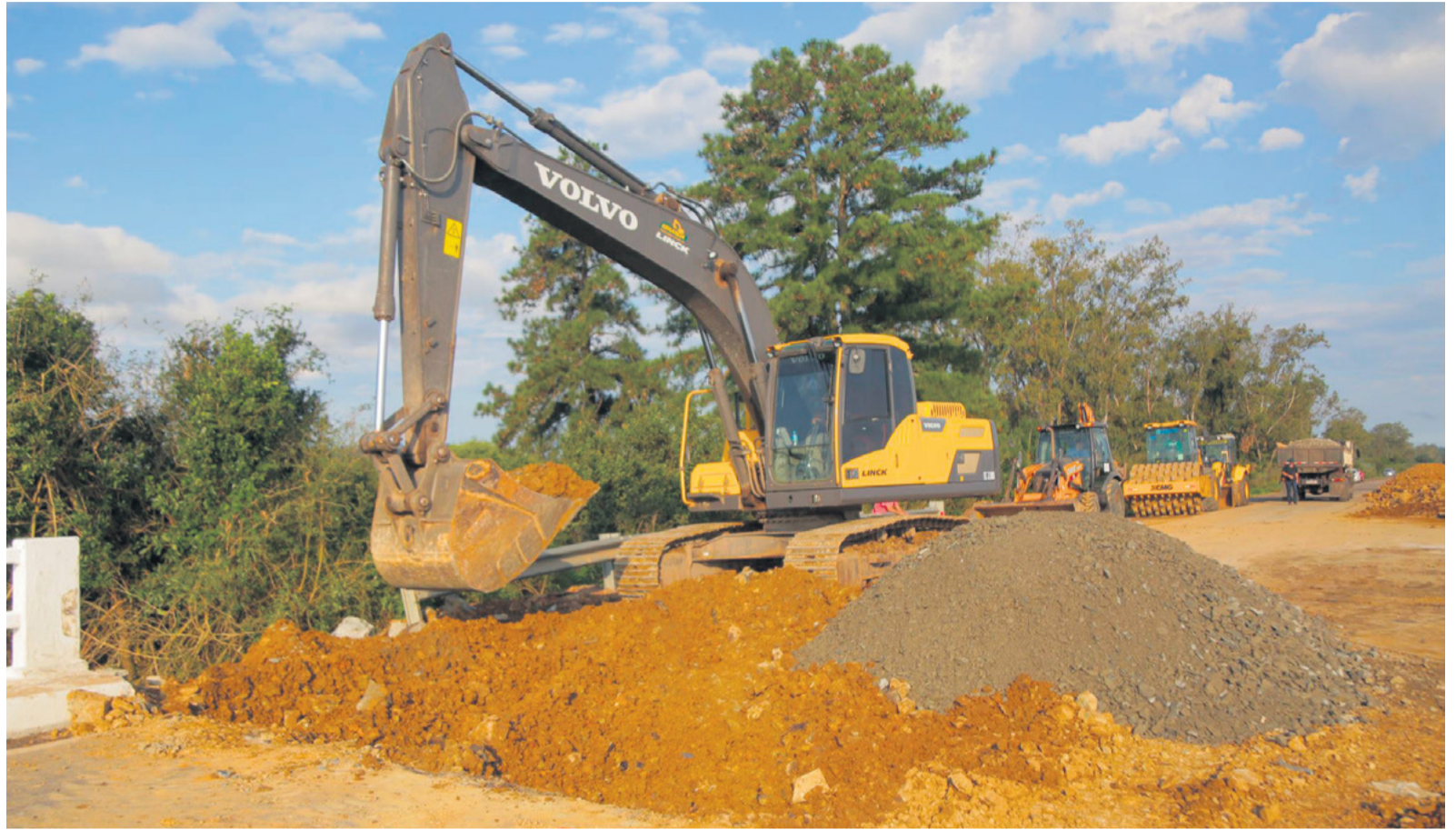
OBRAS Máquinas trabalharam durante o fim de semana para recuperar pontes destruídas. A BR-392, entre Santa Maria e São Sepé, foi liberada ontem

Até a noite de ontem, o Estado somava 78 mortos e 105 desaparecidos, sendo um pessoa em Pinhal Grande, na Região Central. As cheias e os deslizamentos atingiram 341 municípios, desalojando 115,8 mil moradores.