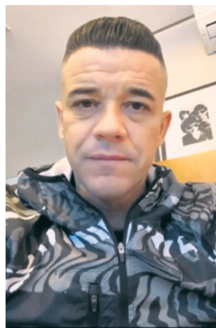
ÍDOLO DO INTER Ex-camisa 10 do Colorado manifestou apoio para os necessitados