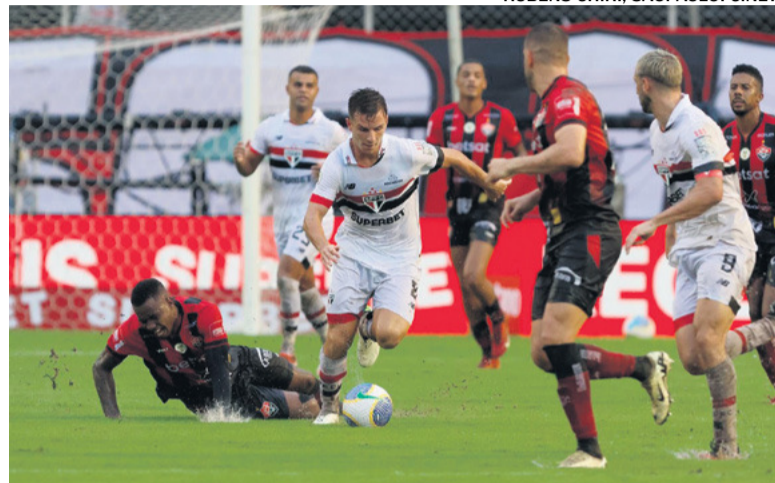
FORA DE CASA O São Paulo derrotou o Vitória no Barradão por 3 a 1

No final de semana, foram disputadas sete partidas válidas pela quinta rodada do Campeonato Brasileiro. Cinco deles haviam terminado até o fechamento desta edição e os resultados foram os seguintes: Atlético-MG 2 x 2 Fluminense; RB Bragantino 1 x 1 Flamengo; Corinthians 0 x 0