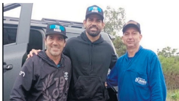
GREMISTA Centroavante Diego Costa (ao centro) abriu sua casa para auxiliar moradores de Eldorado do Sul