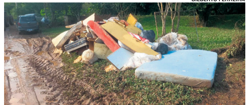
LIMPEZA Famílias começaram a retirar materiais para avaliar estragos

desse grupo contra os veículos que circulavam pelo local como rota entre Santa Maria e Silveira Martins. O Batalhão Rodoviário da Brigada Militar foi até o local para orientar o trânsito e evitar acidentes com as retroescavadeiras que eram empregadas na retirada dos materiais.