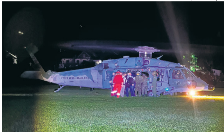
AJUDA Grupo está auxiliando na localização e retirada de famílias ilhadas

Além do Exército, o município também contou com reforço de equipes da Base Aérea de Santa Maria (Basm) para o resgate de mais de 30 pessoas na localidade de Porto Alves, na última quar-