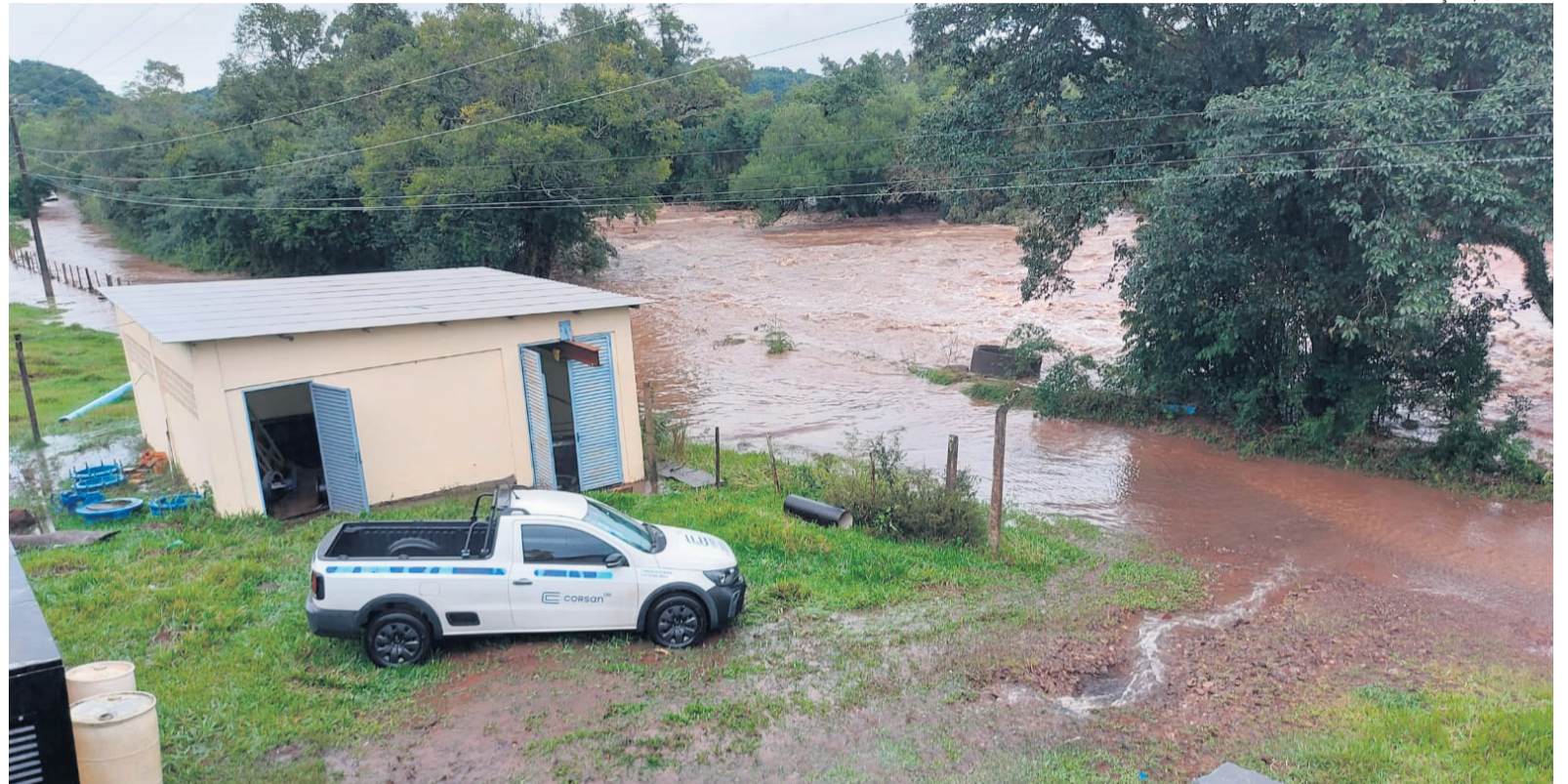
ÁGUA RACIONADA Ontem, com forte chuva, não foi possível trocar as bombas de captação no Rio Ibicuí (acima). Por enquanto, abastecimento de seguirá sendo feita por meio da Barragem da DNOS, alimentada pelo Rio Vacacaí-Mirim, que também está acima do nível normal (fotos abaixo)

Nos demais municípios, as ocorrências são pontuais e estão sendo resolvidas pelas equipes de atendimento da empresa.