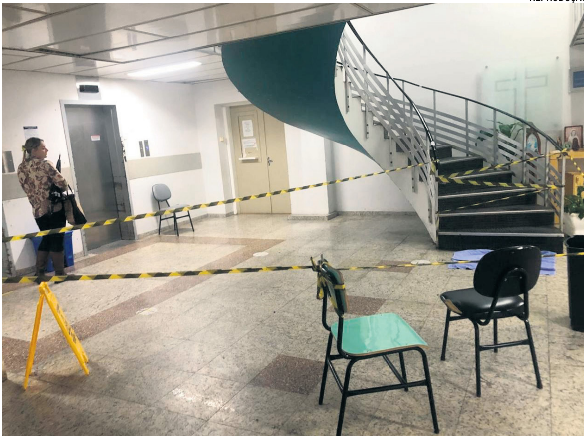
PREVENÇÃO Excesso de chuva afetou o hospital, que precisou interditar áreas e restringir alguns serviços

Aponte a câmera do seu celular para o QR Code acima e confira as últimas atualizações sobre a chuva histórica na região