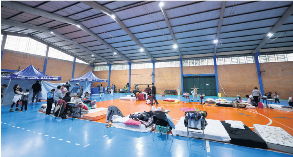
SOLIDARIEDADE Famílias que perderam suas casas estão alojadas em ginásio e dependem de doações

Até ontem, quase 20 famílias estavam abrigadas no ginásio D do Centro Desportivo Municipal (CDM). Um total de 51 pessoas – 29 adultos e 21 crianças, moradores dos bairros Km 3 e Noal – teve que sair de suas casas devido aos alagamentos causados pelas fortes chuvas.