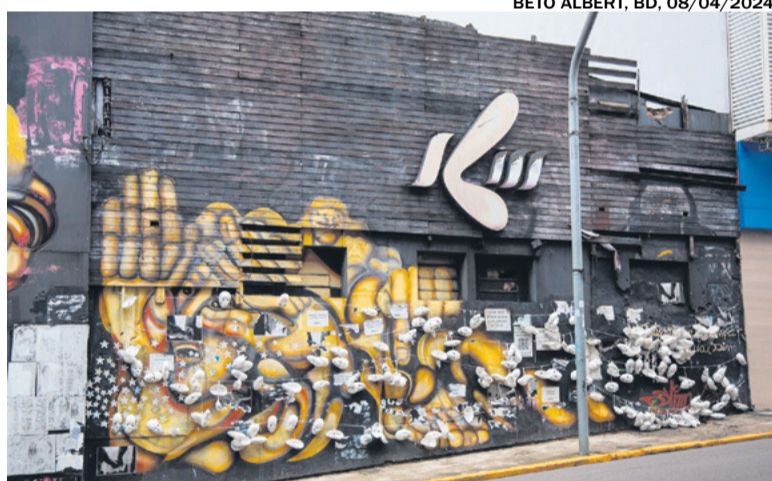
BETO ALBERT, BD, 08/04/2024

Durante o ato, será realizada a remoção do letreiro e da porta principal. A execução dos serviços segue até as 17h do mesmo dia, sendo retomada no dia 13 de maio. As primeiras etapas da execução da obra incluem o recolhimento dos itens classificados pela AVTSM, que farão parte do acervo do Memorial; a remoção do telhado; a classificação dos resíduos que ainda existem no local e recolhimento