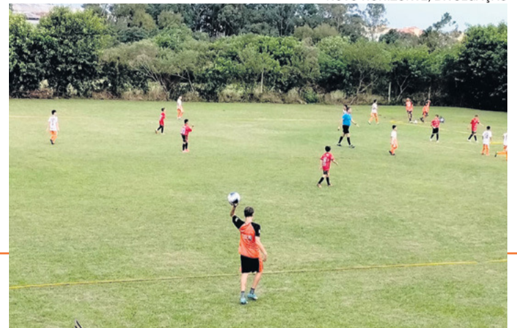
NOVO HORIZONTE, DIVULGAÇÃO