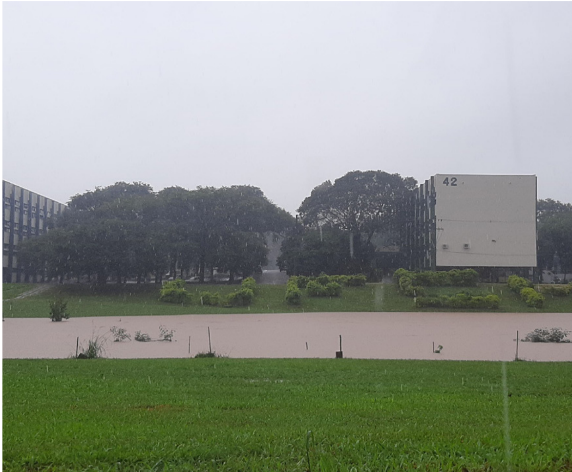
SEGURANÇA Ainda na terça-feira, o campus da UFSM foi evacuado. Amanhã, nova vistoria será realizada

O governo do Estado suspendeu as aulas na rede pública