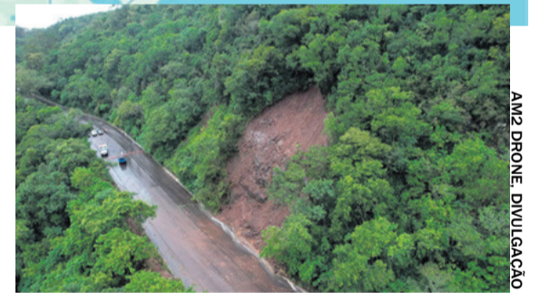
BR-158: DESLIZAMENTO EM ITAARA

DESVIO POR SANTIAGO FOI INTERROMPIDO - Às 19h de ontem, houve bloqueio da BR-287 na várzea do Rio Toropi, perto de Mata. Com isso, não é mais possível ir de Santa Maria a Santiago e pegar a ERS-377 em direção a Joia e Cruz Alta, que era um desvio para o Norte do Estado. Talvez a situação mude hoje